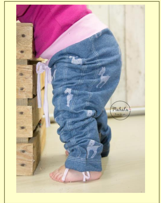
Winterbux ILvy

Die Winterbux Ilvy wird im September für die kleinsten in den Gr. 56- 104 mit einer windelfreien Erweiterung erscheinen.