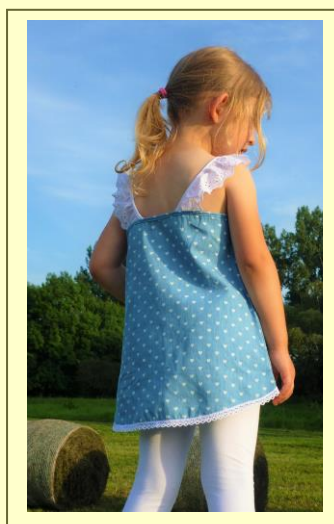
Top Marie- Trägervariante

Und das Beste daran, du musst den Newsletter nicht abonnieren. Er landet auch nicht im Spamordner oder du erhältst ständig neue Emails. Nein, lade ihn dir kostenlos und unverbindlich einfach als PDF runter, immer dann und wann du willst.